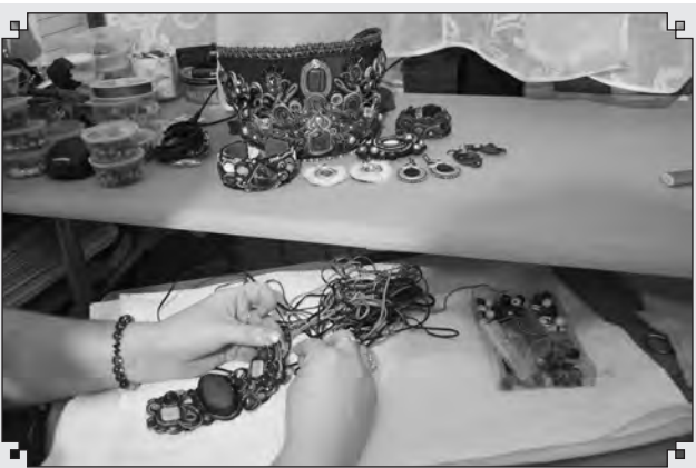
Вышивка не позволит вам заскучать, сидя дома

Средний Урал славится не только своей промышленностью, но и природой, в том числе — многообразием полезных для человека ягод, растений и трав. Практически из всех них можно сделать тонизирующий, бодрящий и богатый на витамины напиток — чай. Попробовать себя в этом деле как раз и направлен проект, в рамках которого будут разработаны местные бренды и налажено производство уникальной сувенирной продукции от мастеров и ремесленников Невьянского района. Группа планирует организовать три сувенирные мастерские, на которых участники ознакомились с технологией создания местного чайного бренда и особенностями составления чаев и напитков из местных уральских трав. Проект посвящен созданию гастрономического чайного сувенира, который подчеркнет культурные смыслы территории, с вовлечением местных жителей, желающих научиться создавать свою неповторимую сувенирную продукцию.