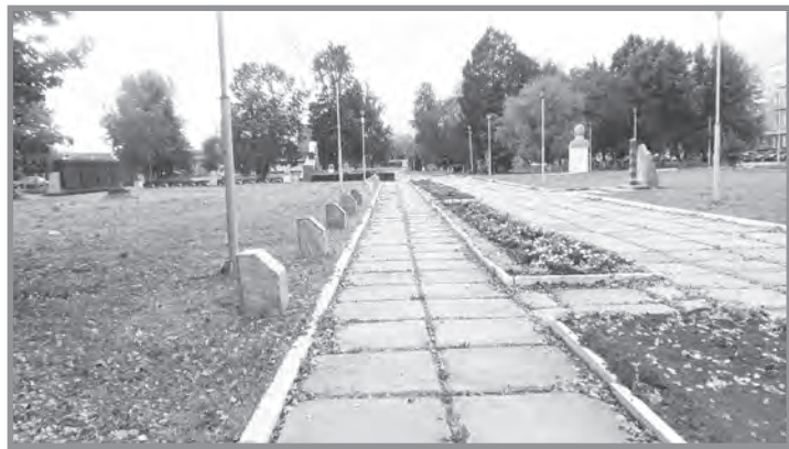
Мемориал в г.Невьянске

Перечень общественных территорий города Невьянска для проведения общественных обсуждений и рейтингового голосования по выбору общественной территории, подлежащей благоустройству в первоочередном порядке