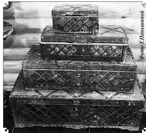
В настоящее время собрано более 30 старинных сундуков

Участие в проекте «Культурная мозаика» даст положительный эффект для развития. В рамках гранта запланировано проведение встреч с местными жителями. Главная задача — создание сплоченного местного сообщества и центра притяжения для туристов. Музей быньговских сундуков станет общественным культурным пространством и общим делом для активистов. Помимо музейной экспозиции, в здании музея будут проходить мероприятия разной направленности, будет запущена реставрационная мастерская, фестивали, семинары и лекции.