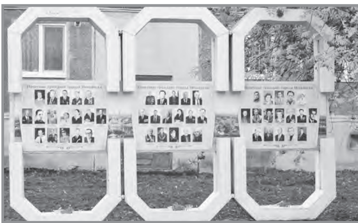
Аллея Славы в г.Невьянске