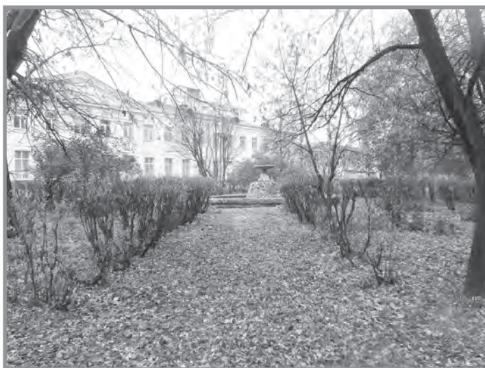
Сквер у ДК машино- строителей в г.Невьянске