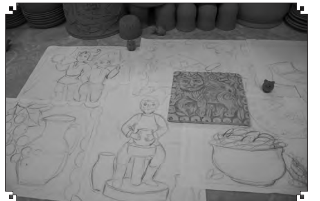
Эскизы изразцов ждут воплощения в глине

Участие в программе «Культурная мозаика малых городов и сёл» позволит популяризировать русскую народную культуру, передать опыт сельских мастеров, расширить экскурсионные маршруты и увеличить количество мастер-классов для приезжающих туристов, в первую очередь — по изготовлению сувенирной продукции. Проект позволит воссоздать технологию создания шуралинских варежек. В процессе мастер-класса с нашими гостями варежки будут обшиты и украшены. И как результат проекта — привлечение внимания местных жителей к собственной истории села, народным промыслам и краеведению. Большие надежды возлагаются на привлечение молодежи.