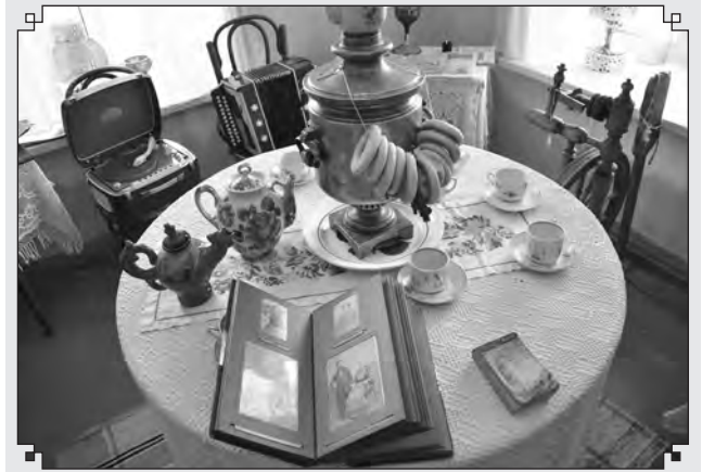
Все вещи для экспозиции собраны местными жителями

Кроме того, овладение методом интуитивной сутажной вышивки может заложить начало собственного дела, поскольку является, с одной стороны, достаточно редким видом творчества, а с другой — узнаваемым и востребованным.