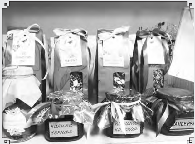
Каждый сможет сделать чай своими руками

При поддержке благотворительного фонда Елены и Геннадия Тимченко пять проектов невянцев получили гранты в размере 20 тысяч рублей на реализацию мастер-классов и развитие старинных ремесел. Главная задача для всех участников — как можно большее вовлечение к участию местных жителей, возрождение и развитие народных промыслов, продвижение въездного туризма в Свердловской области. Журналист газеты «Звезда» пообщался с каждым из участников и более детально узнал о каждом проекте «из первых рук».